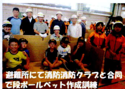
避難所にて消防消防クラブと合同で段ボールベット作成訓練