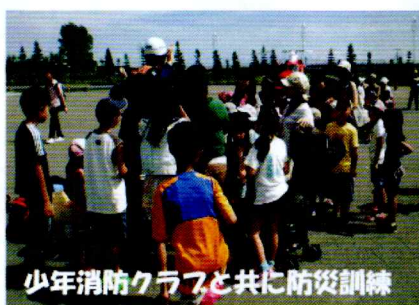
少年消防クラブと共に防災訓練